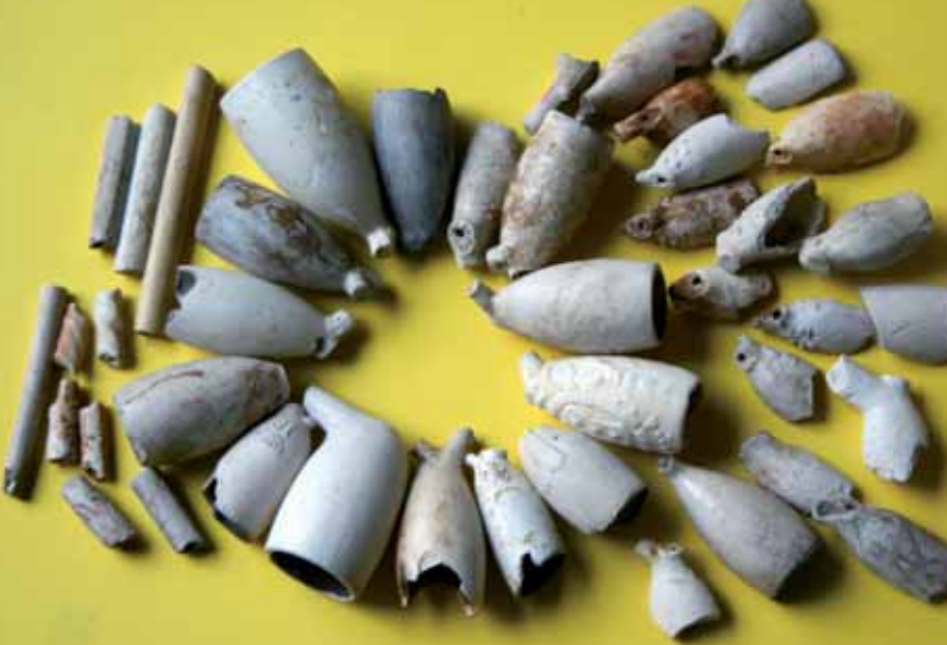
▲ Pijpenkoppen ▼ Ringen