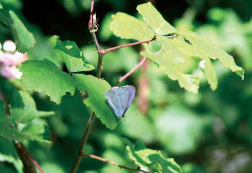
▲ Boomblauwtje ▼ Bont zandoogje