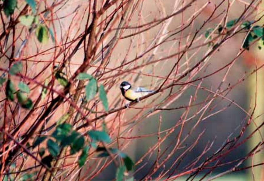
▲ Koolmees ▼ Roodborst