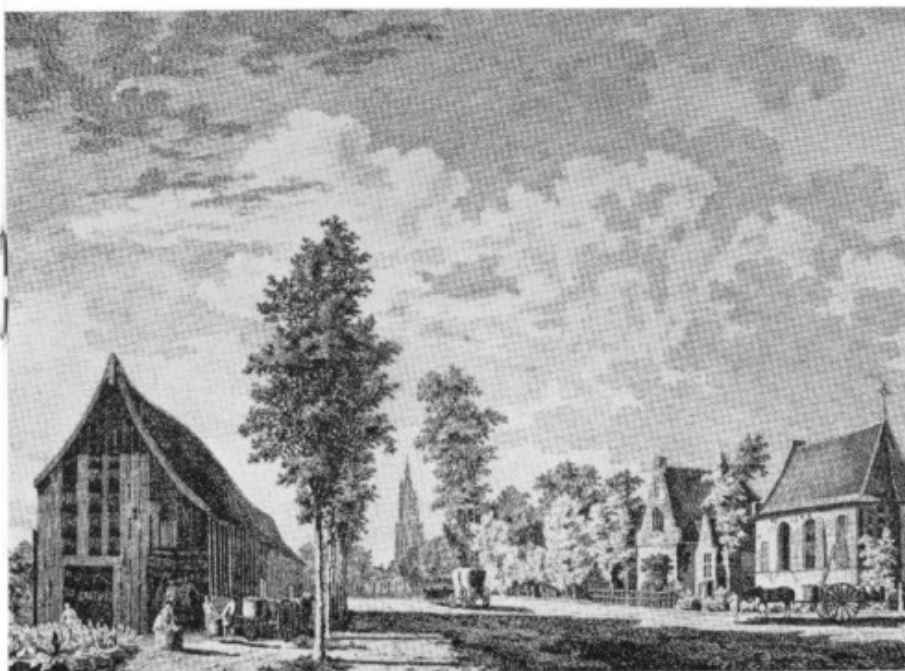
De Hoge Weg bij 't Lazarushuis in 1759