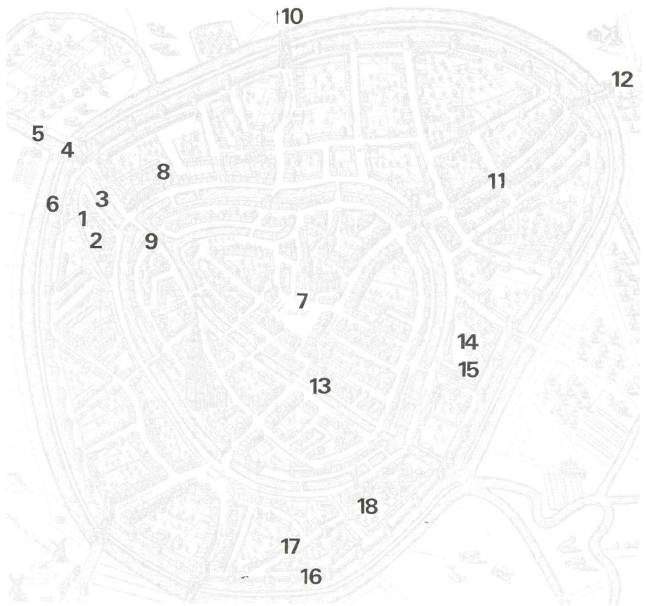
PLATTEGROND door G. Braun en F. Hogenberg, 1588; naar de werkelijke toestand van \pm 1579 getekend.